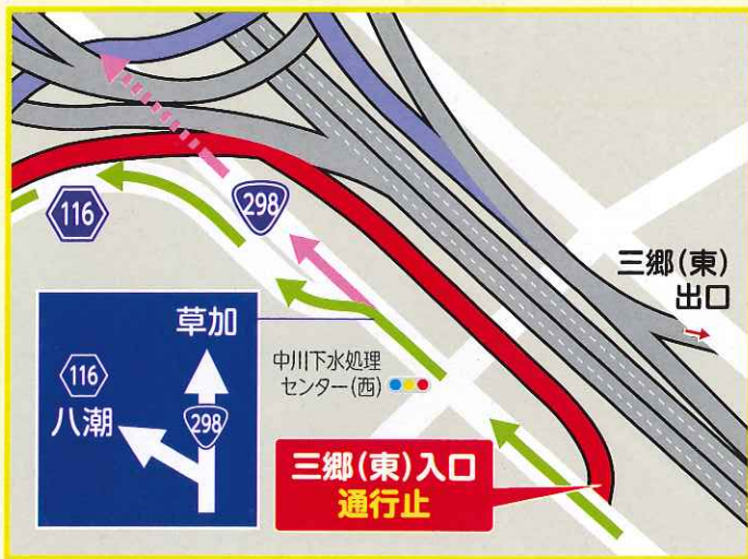
国道298号の側道、県道116号八潮方面への詳細図

通行止箇所 外環道(三郷南方面)から6三郷線(上り)はご利用頂けません ※ 常磐道へはご利用頂けます